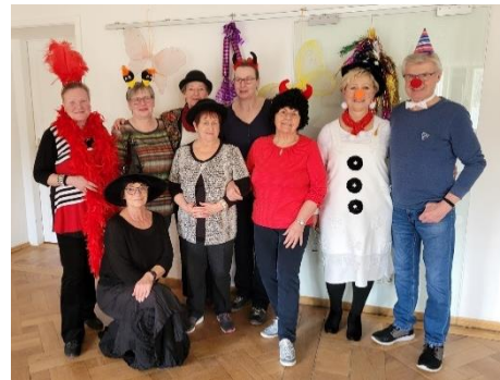
wie hier bei den Line Dancern.

In den Kindertagesstätten und auch in den Begegnungsstätten wurde Fasching gefeiert - mit bunten Hütchen, Kostümen und Pfannkuchen-